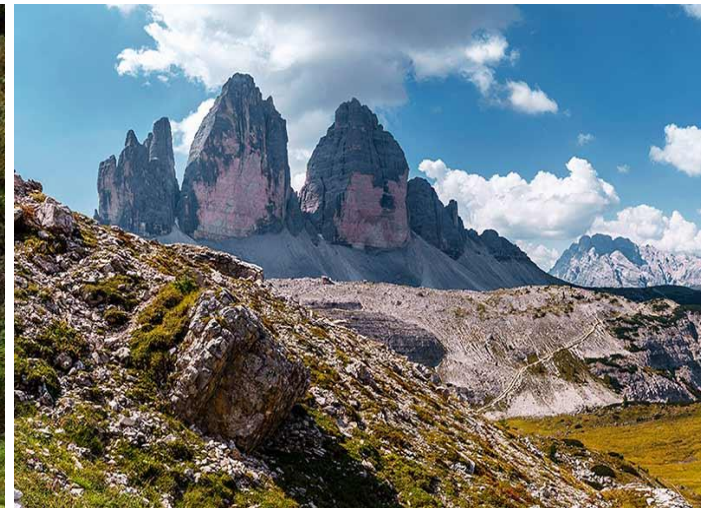
Tre Cime di Lavaredo