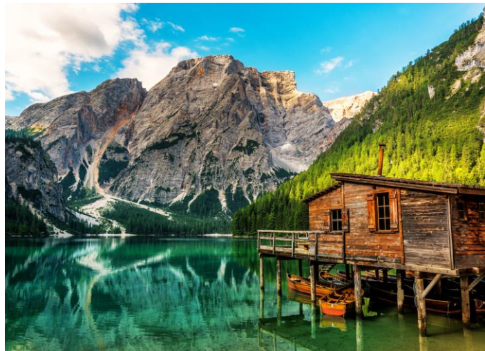
Lago di Braies

La Val Pusteria è una delle valli più belle dell'Alto Adige e spesso viene chiamata anche la valle verde dell'Alto Adige. Si estende da Sesto in Alta Val Pusteria fino ai confini con la Valle Isarco, dopo Brunico. Malghe e pascoli infiniti, laghetti isolati e soprattutto le impressionanti cime delle Dolomiti saranno i protagonisti assoluti delle vacanze in Val Pusteria. Le famose Tre cime , i parchi naturali e i colori mozzafiato: in Val Pusteria vi sentirete proprio nel cuore delle Dolomiti ! Scoprirete le Tre Cime di Lavaredo , i laghi di Braies e di Dobbiaco. Non mancano nemmeno le possibilità per chi ama la cultura e le bellezze architettoniche, centri come Brunico, San Candido, offrono musei, antiche chiese e masi, piazze tradizionali e moderne, spazi verdi con percorsi tematici e molto altro ancora!