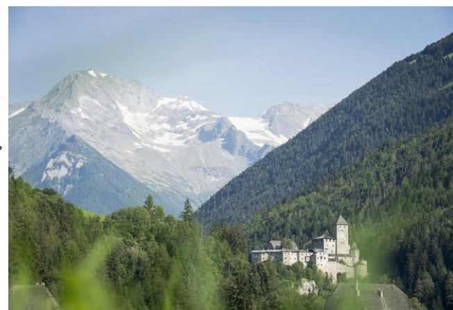
VAL DI TURES E VALLE AURINA