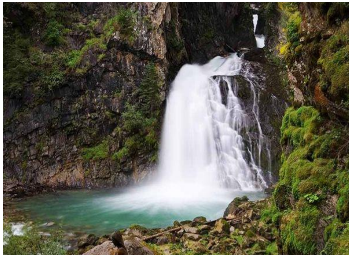
Cascate di Riva