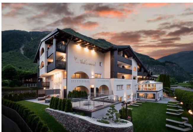
Vitaurina Royal Hotel MOLINI DI TURES