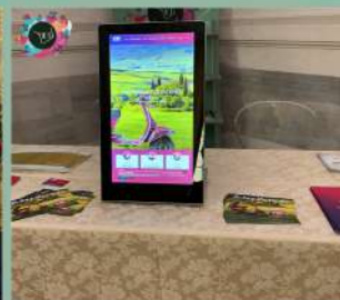
EXHIBITION ITALIANFOOD AND TOURISM VENEZIA 13-16 NOVEMBRE 2021 Hotel Monaco & Gran Canal