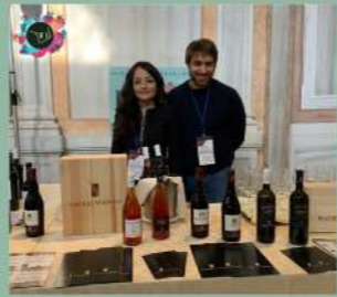
EXHIBITION ITALIANFOOD AND TOURISM VENEZIA 13-16 NOVEMBRE 2021 Hotel Monaco & Gran Canal