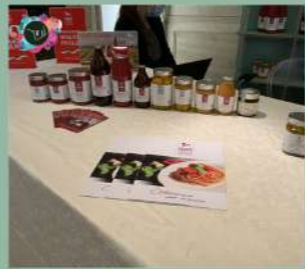
EXHIBITION ITALIANFOOD AND TOURISM VENEZIA 13-16 NOVEMBRE 2021 Hotel Monaco & Gran Canal