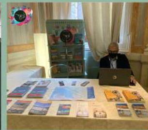
EXHIBITION ITALIANFOOD AND TOURISM VENEZIA 13-16 NOVEMBRE 2021 Hotel Monaco & Gran Canal