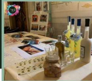
EXHIBITION ITALIANFOOD AND TOURISM VENEZIA 13-16 NOVEMBRE 2021 Hotel Monaco & Gran Canal