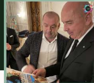
EXHIBITION ITALIANFOOD AND TOURISM VENEZIA 13-16 NOVEMBRE 2021 Hotel Monaco & Gran Canal