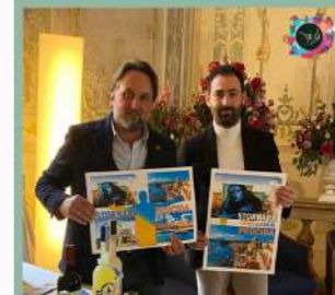
EXHIBITION ITALIANFOOD AND TOURISM VENEZIA 13-16 NOVEMBRE 2021 Hotel Monaco & Gran Canal