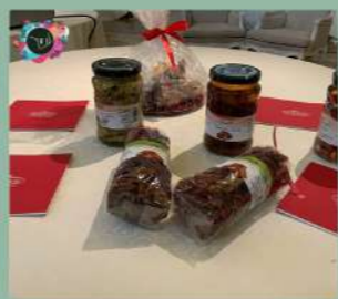
EXHIBITION ITALIANFOOD AND TOURISM VENEZIA 13-16 NOVEMBRE 2021 Hotel Monaco & Gran Canal