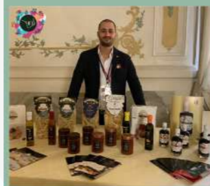
EXHIBITION ITALIANFOOD AND TOURISM VENEZIA 13-16 NOVEMBRE 2021 Hotel Monaco & Gran Canal