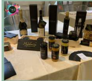
EXHIBITION ITALIANFOOD AND TOURISM VENEZIA 13-16 NOVEMBRE 2021 Hotel Monaco & Gran Canal