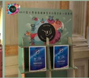
EXHIBITION ITALIANFOOD AND TOURISM VENEZIA 13-16 NOVEMBRE 2021 Hotel Monaco & Gran Canal