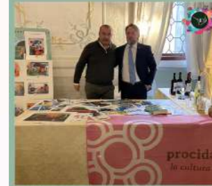
EXHIBITION ITALIANFOOD AND TOURISM VENEZIA 13-16 NOVEMBRE 2021 Hotel Monaco & Gran Canal