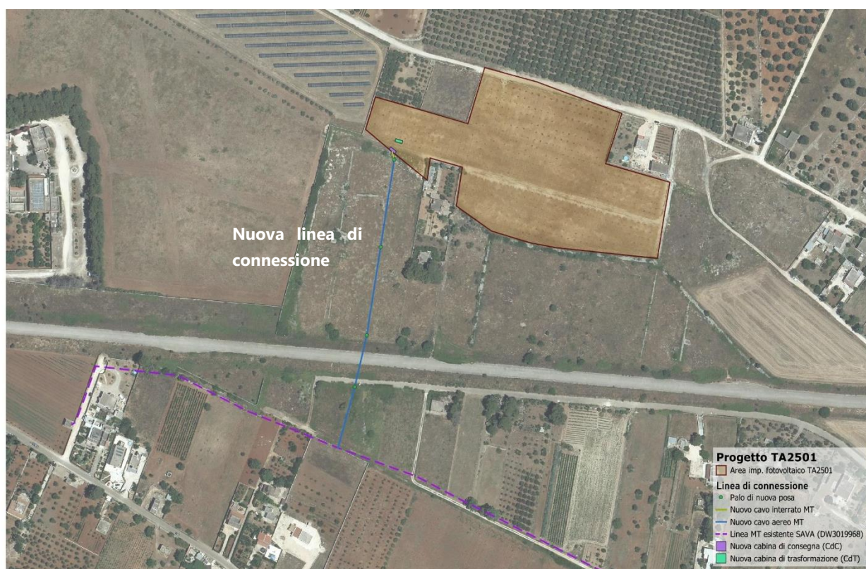
Figura 1 - Inquadramento elettrodotto di connessione dell'impianto AFV, su base Ortofoto

La connessione alla rete elettrica avverrà tramite la realizzazione di nuova linea elettrica prospiciente l'impianto fotovoltaico, intercettante aree di proprietà di terzi, costituita da due tratti (uno in cavo aereo e l'altro in cavo interrato); le servitù di elettrodotto tra la società proponente e gli attuali proprietari sono in fase di richiesta in corso.